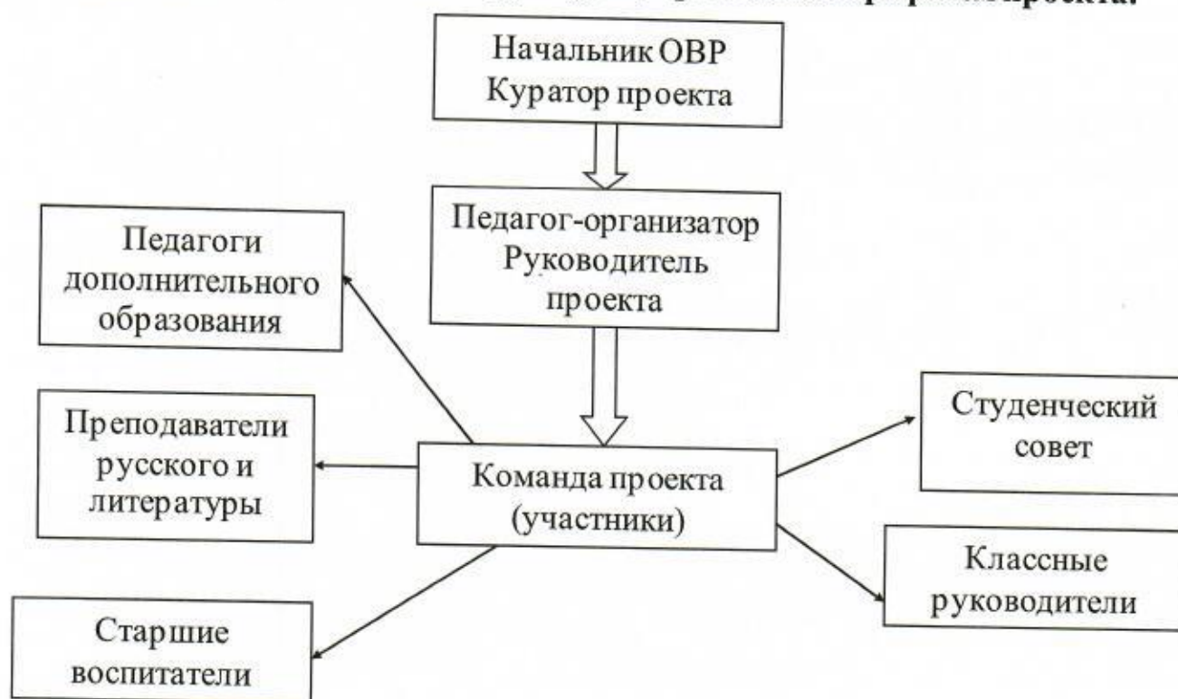
Схема организационной структуры управления портфелем проекта.